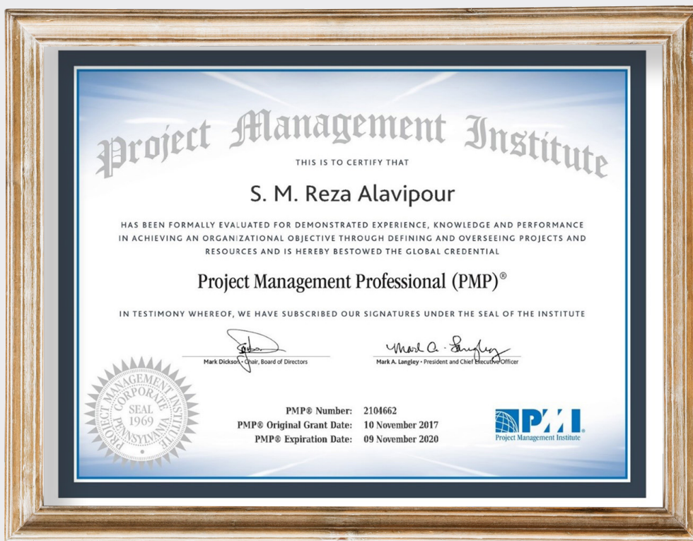
مدرک مدیریت پروژه حرفه‌ای (PMP) از موسسه PMI