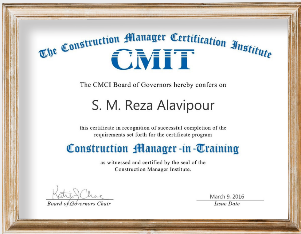
مدرك مدیریت ساخت CMIT از انجمن CMAA