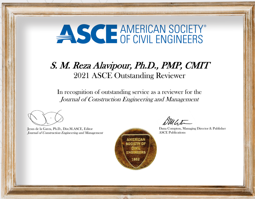
داور برجسته (Outstanding Reviewer) ژورنال ASCE