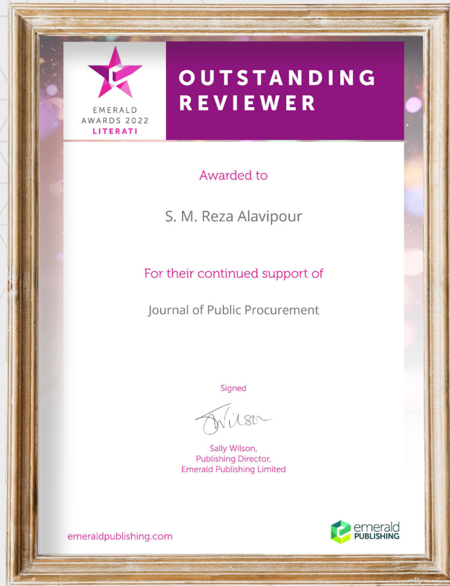
جایزه داور برجسته (Outstanding Reviewer) از ژورنال Journal of Public Procurement