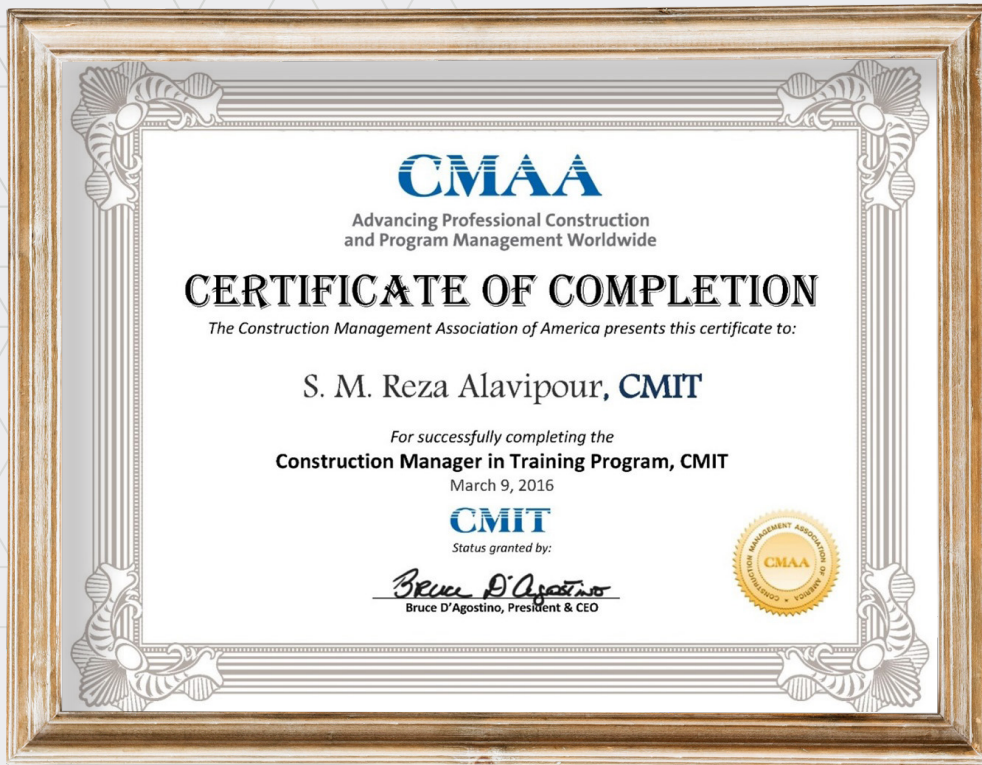
مدرك مدیریت ساخت CMIT از انجمن CMAA