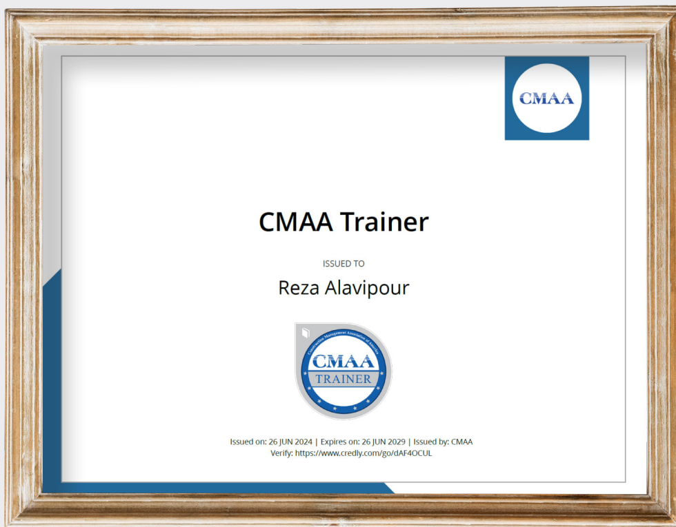
بج رسمی CMAA Trainer از طرف انجمن مدیریت ساخت آمریکا با عنوان مدرس مرجع