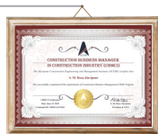
گواهینامه تایید صلاحیت

Construction Business Manager in Construction Industry - CBMCI