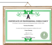
گواهینامه مشاوره حرفه‌ای